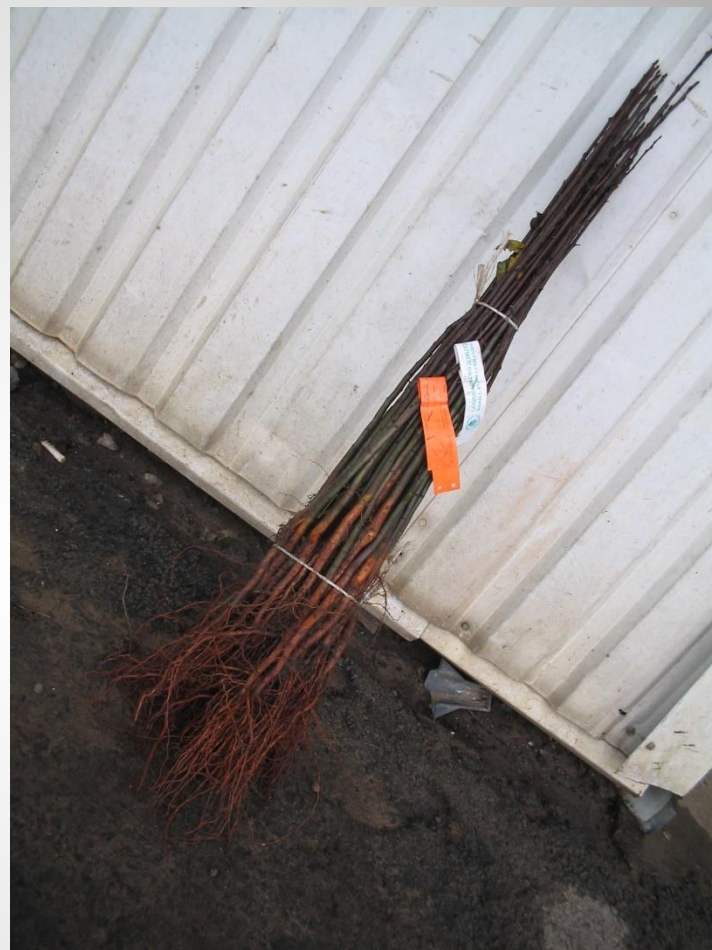
BA-29 4-6 mm és Pyrus caucasica köteg (PL)