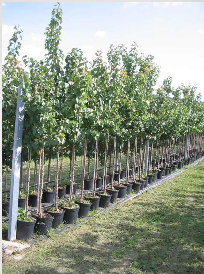
Konténeres kajszioltványok (A)