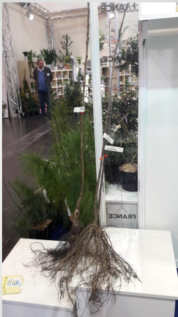
Dióoltvány szabadgyökérrrel (F)