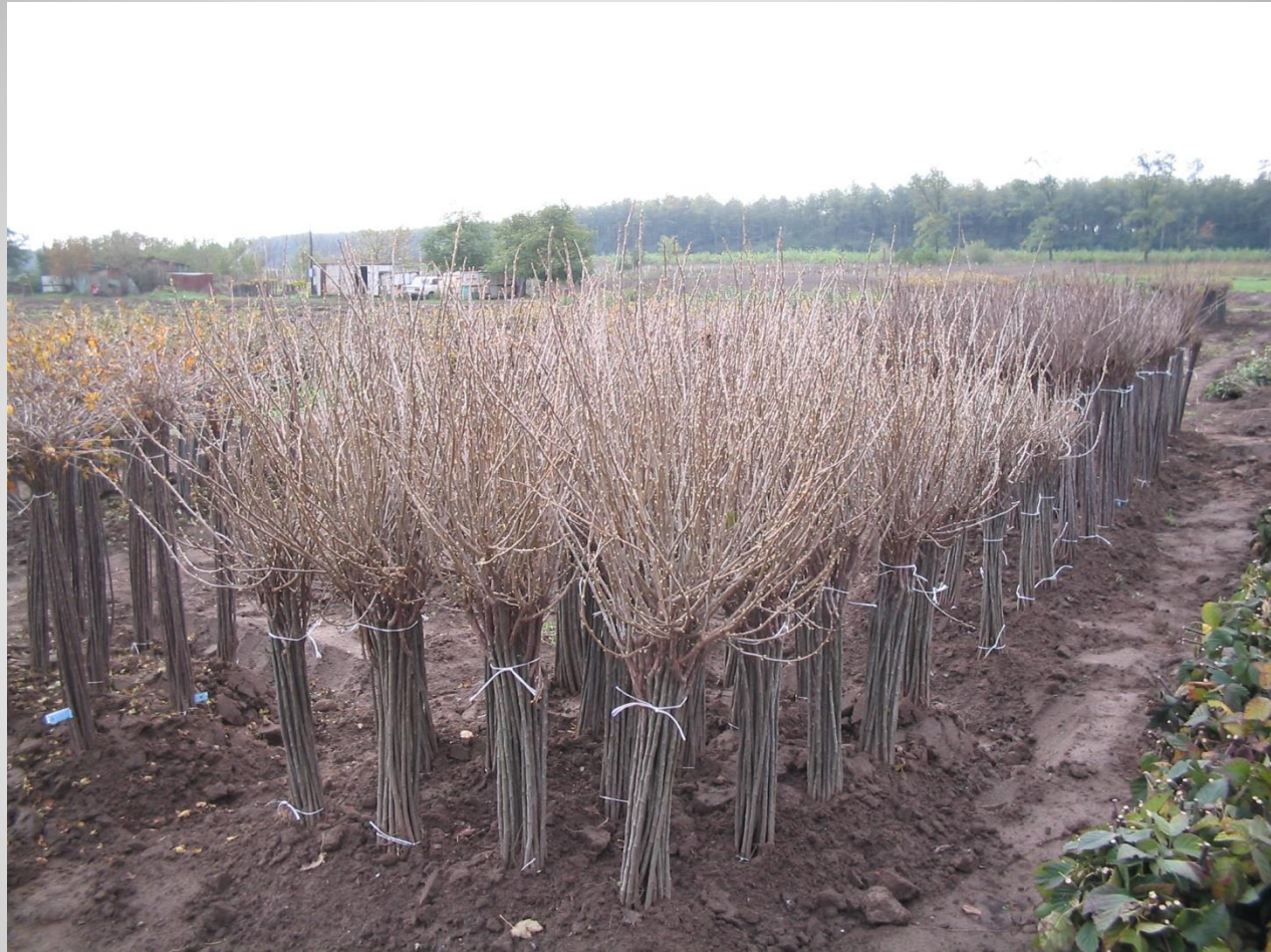
Törzsés fekete ribiszkék (H)