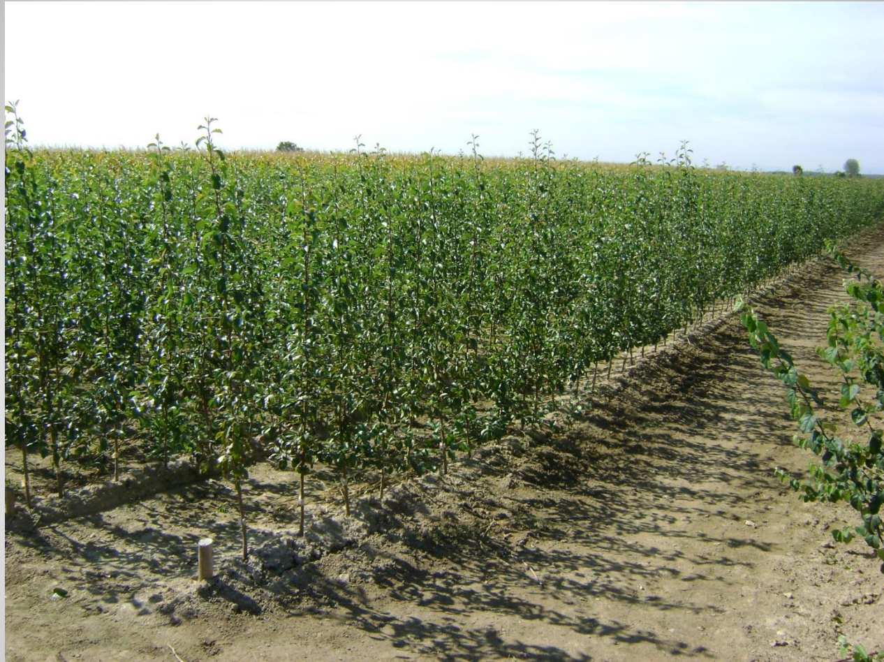
Szemzett Pyrodwarf alanyok (D)