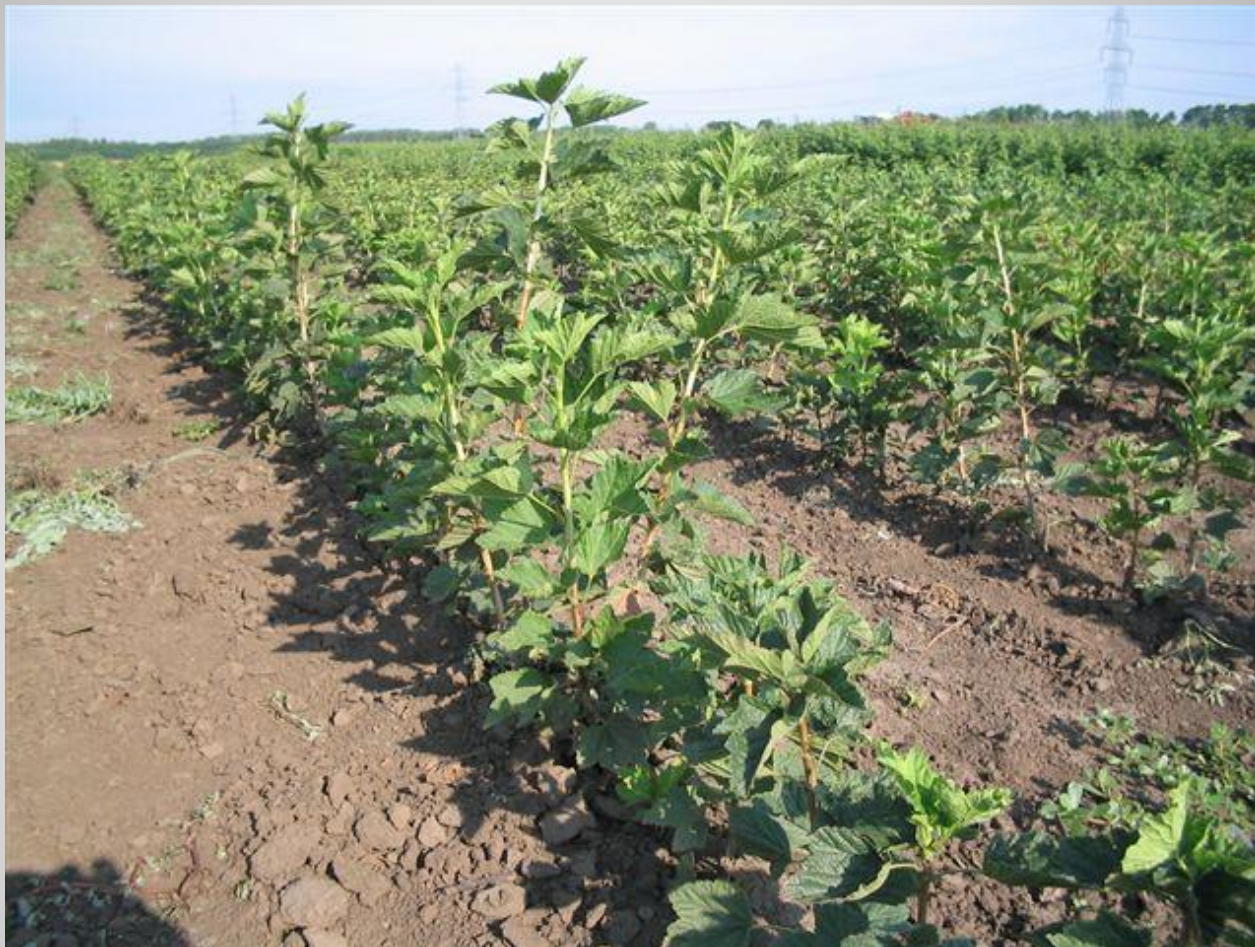
Pirosribiszke dugványok (H)