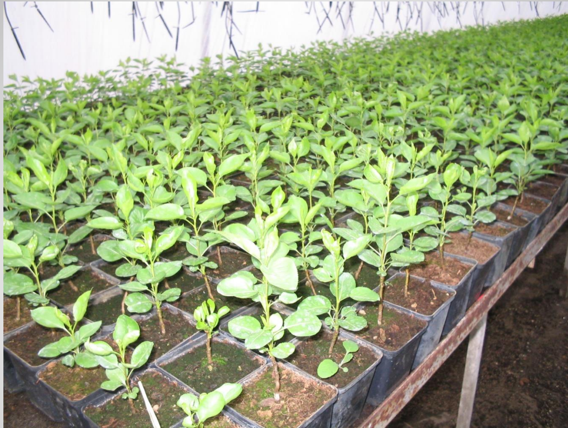
Pyrodwarf alanyok cserépben (D-H)