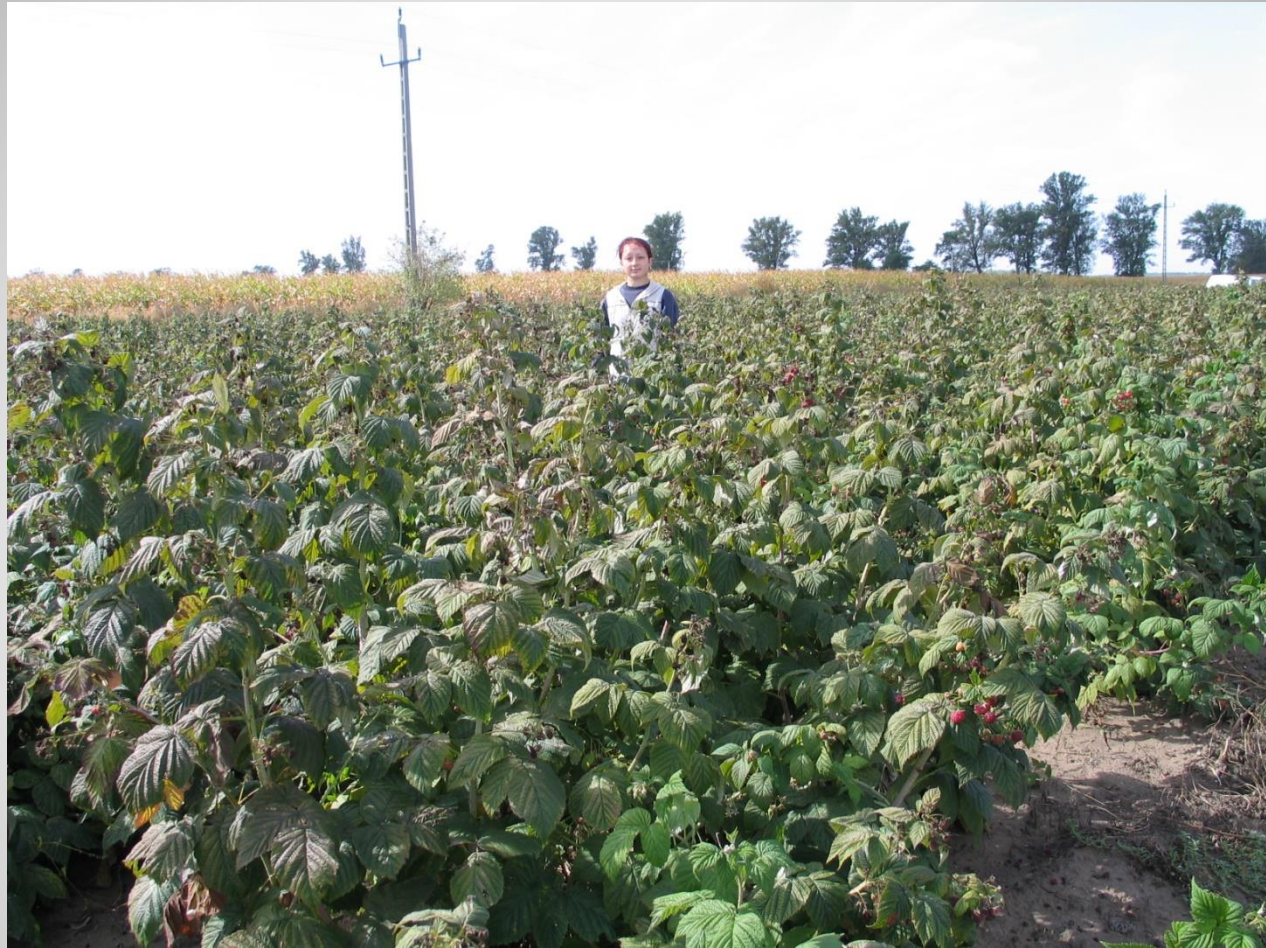
Málnasarj anyatelep vegetációban (H)