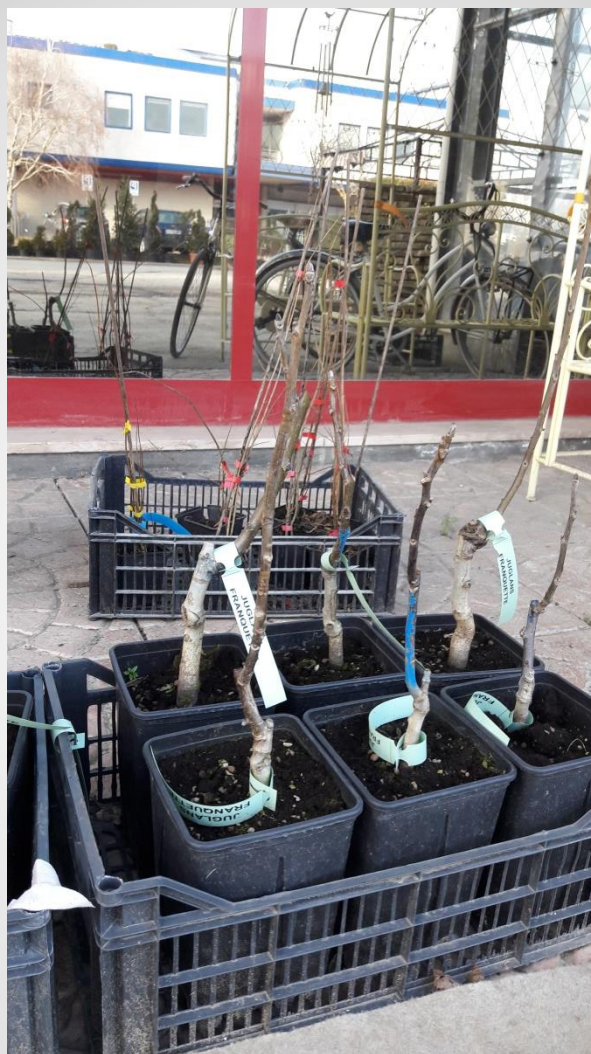
Dióoltvány konténerben, 1 éves (I)